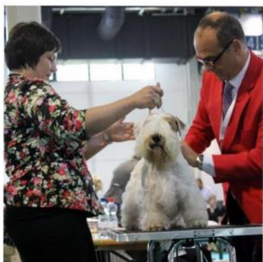
SEVENTY SEVEN TWIST STAR

Дадди: Туся, как вы готовились к выставке?