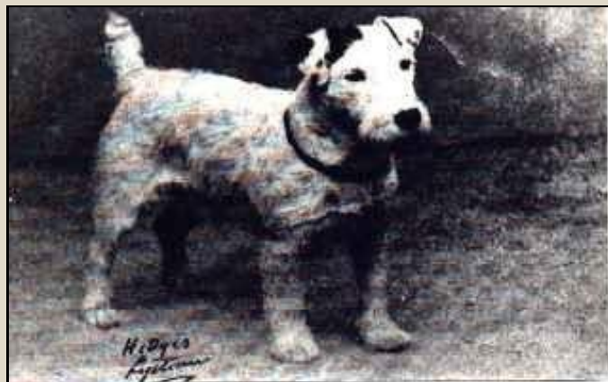
(Peer Gynt )