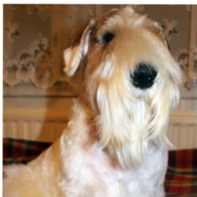
SEVENTY SEVEN TIP-TOP BOY

Дадди: Атос, как вы готовились к выставке?