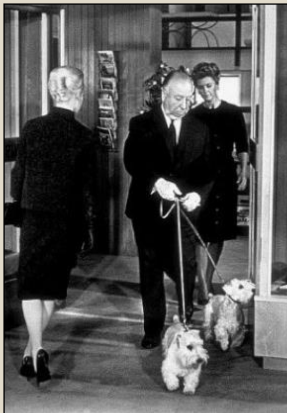
(Альфред Хичкок со своими силихемами в фильме «Птицы»)

Ричарда Бартон и Хамфри Богарта. Хичкок, голливудский режиссер, известный своими ролями-камео во всех своих фильмах, снялся и в фильме "Птицы" (The Birds). В начале фильма Хичкок появляется на пороге магазина со своими силихемами Стэнли и Джеффри в тот момент, когда туда входит Тippi Хедрен. Третьего силихема Хичкока, Мистера Дженкинса, можно увидеть в фильме "Подозрение" (Suspicion).