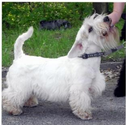
ALBAROSSII'K HIGH HOPE