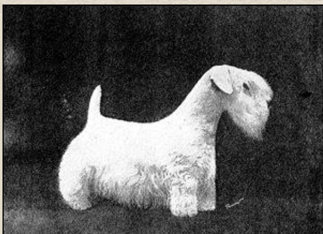
(St. Margret Steve)