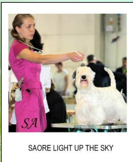
SAORE LIGHT UP THE SKY