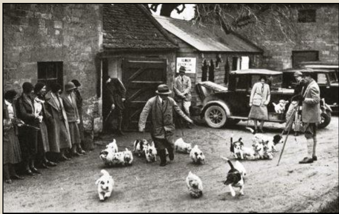
(Свора силихемов Ilmer)