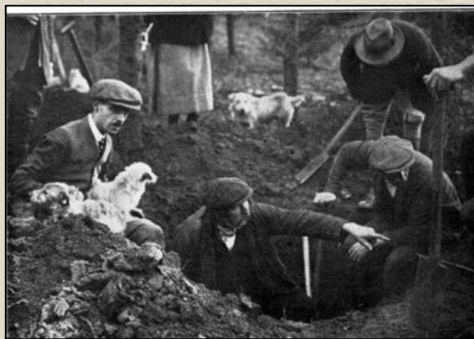
(Охота на барсука)

силихемов, как одновременно выставочных и рабочих собак, нынешние некрупные силихем терьеры лишь немного напоминают своих рабочих предков. В 1935 году в "Энциклопедии собак" Хатчинсона было написано что чемпионы ринга силихем терьеров "были слишком крупными и тяжелыми для той работы, которая выполнялась ими изначально".