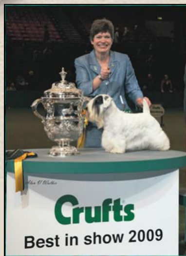
(Efbe's Hidalgo at Goodspice - Лучшая собака выставки Crufts-2009 В Бирмингеме.)

После победы в Бест ин Шоу на Национальном Чемпионате Еканубы, Чармин участвовал в рекламе корма Екануба. Американский клуб любителей силихем терьеров насчитывает около 300 членов. Несмотря на то, что большинство современных силихемов – выставочные собаки или домашние любимцы, некоторые из них преуспевают в таких видах спорта как аджилити и обидиенс, а также в соревнованиях норных охотничьих собак.