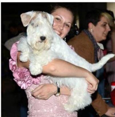
DUNYA PRAGUE SNOWDROP

Гриша: Никогда не видел столько меня в одном месте! Кое с кем познакомился и немножко позаигрывал... С кем-то из парней пытался отношения выяснить (мама с папой, правда, не разрешили...)