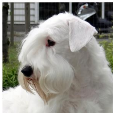
STEP FORWARD VISTA

Туся: Я никогда не видела столько МЕНЯ в одном месте!